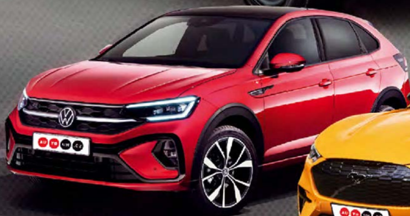
Volkswagen Taigo lifestylový crossover