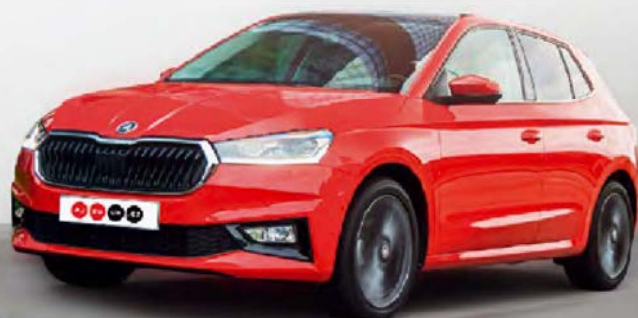
Škoda Fabia čtvrté generace