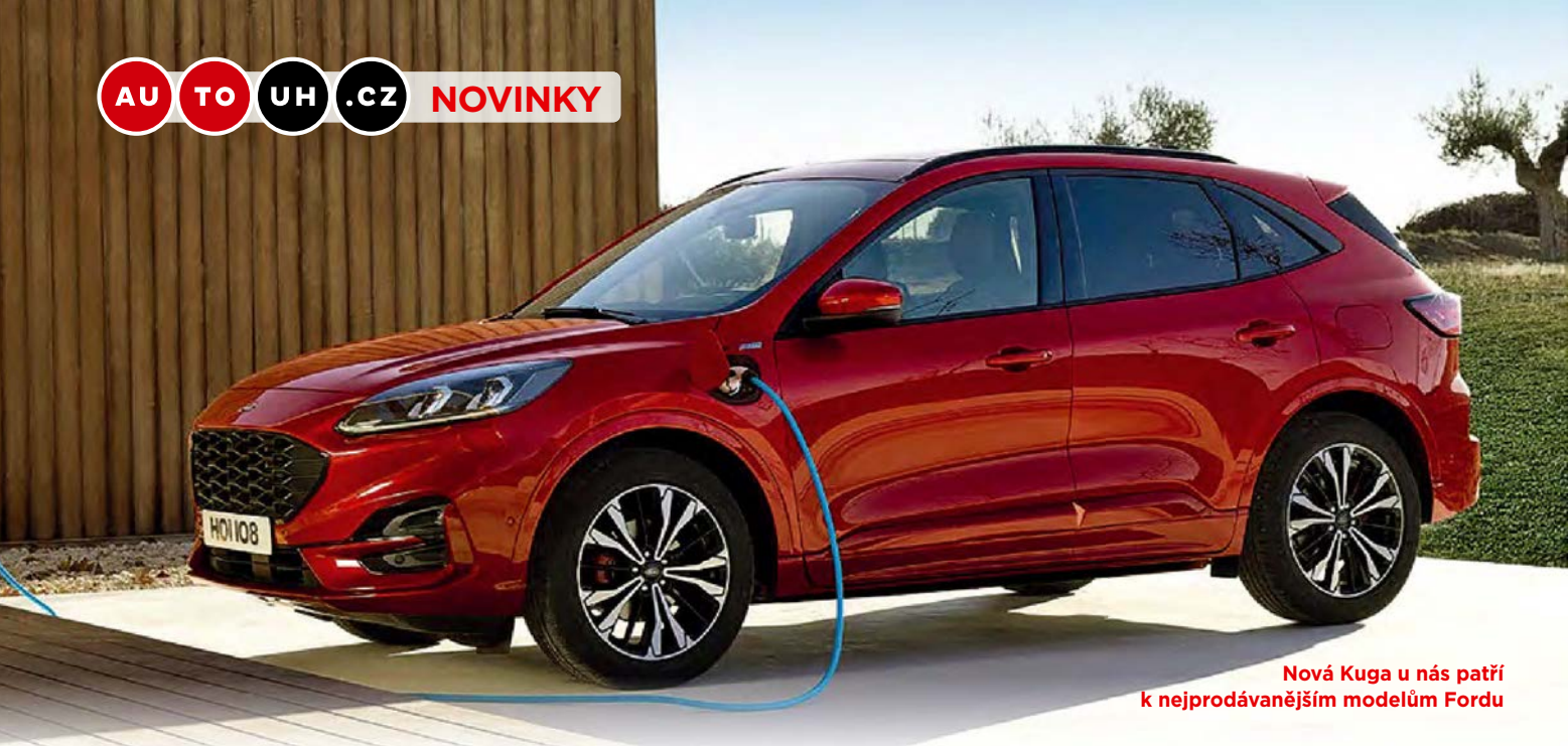
Nová Kuga u nás patří k nejprodávanějším modelům Fordu