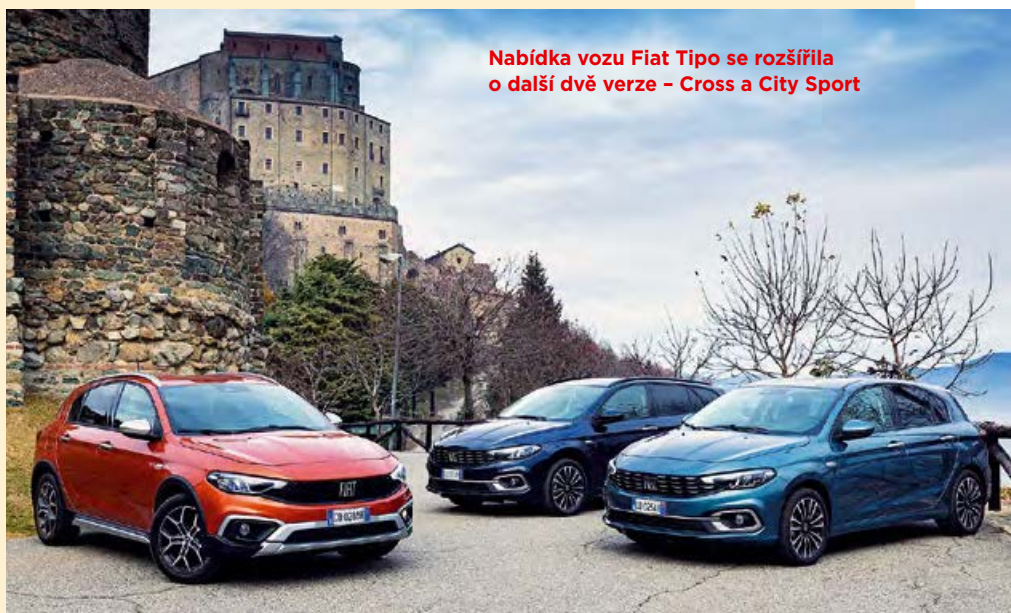
Nabídka vozu Fiat Tipo se rozšířila o další dvě verze – Cross a City Sport

Tipo City Sport je v prodeji v pětiveřové variantě hatchback a jako čtyřdveřový sedan. Pod kapotou je místo pro vznětový přeplňovaný agregát 1.6 MultiJet o výkonu 130 k, případně zážehový stokoňový 1.0 GSE T3.